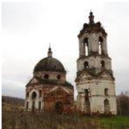
Казанская церковь с. Детково ныне Павловского р-на.