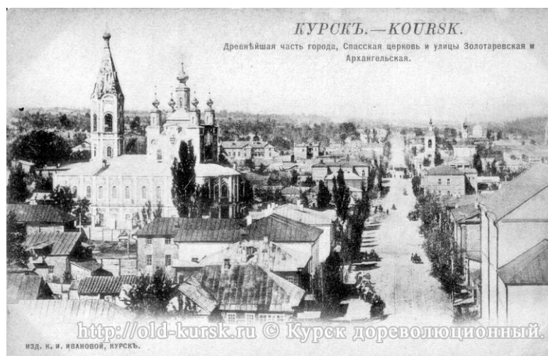
Золотаревская улица в г. Курске.