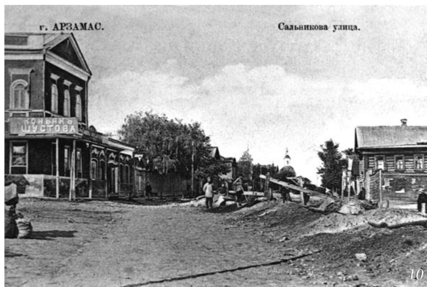
Город Арзамас. Вдалеке церковь Спаса Нерукотворного