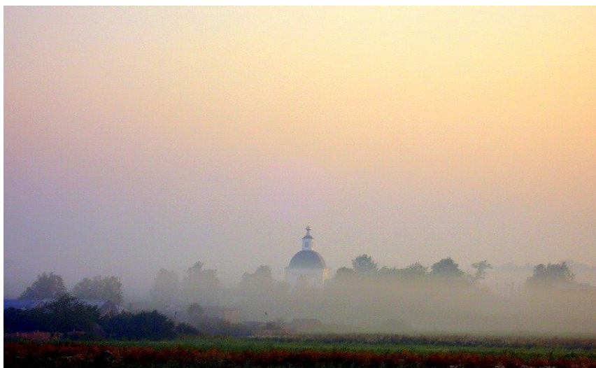
Раннее утро в с. Кузнецкое в наше время.